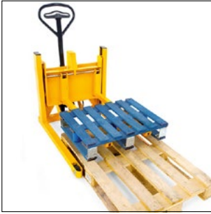
Retirada de meio palete de um europaletes padrão