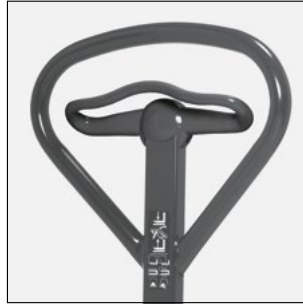
Elemento de comando ergonômico