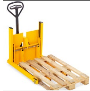
Suporte de um europaletes padrão